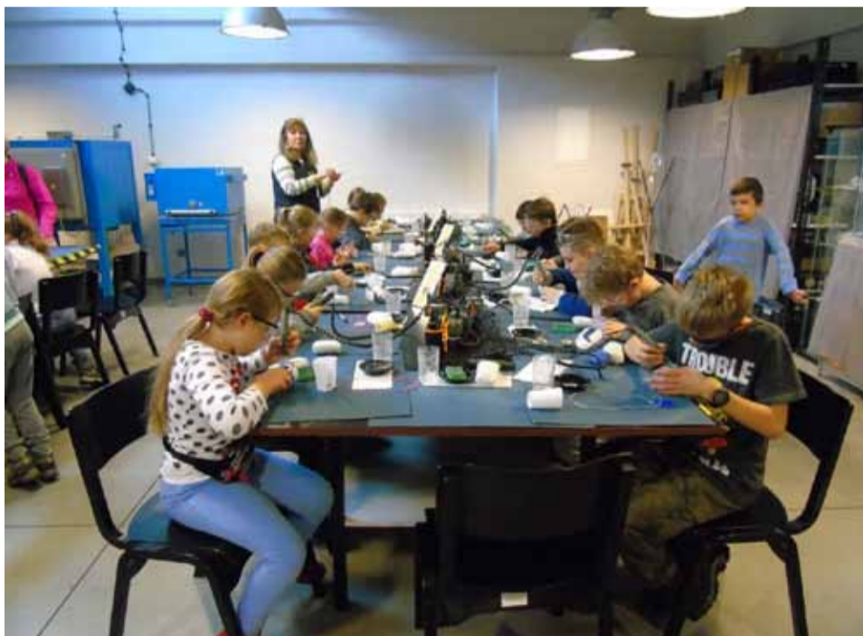
Uczniowie uczestniczyli w zajęciach praktyczno-technicznych w warsztacie grawerowania szkła