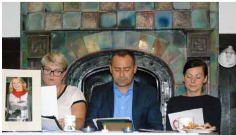
Wysmakowana interpretacja utworów poetyckich w wykonaniu profesjonalnych aktorów