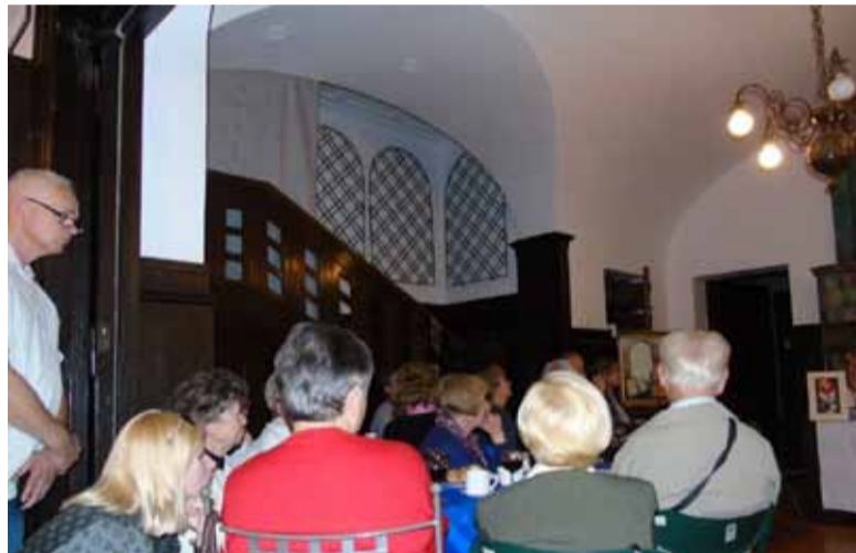
Stali bywalcy -zadumani, zasłuchani, wzruszeni...