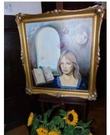
Dobra czarodziejka bibliotekarka na portrecie z młodości, od dziecka z książką...