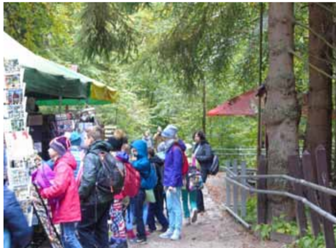
Bez pamiętki wycieczka się nie liczy