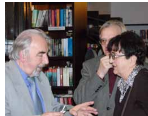
Bywalcy na Jesiennej dziękowali za wykład i dzielili się swoimi przemyśleniami o Witkacym