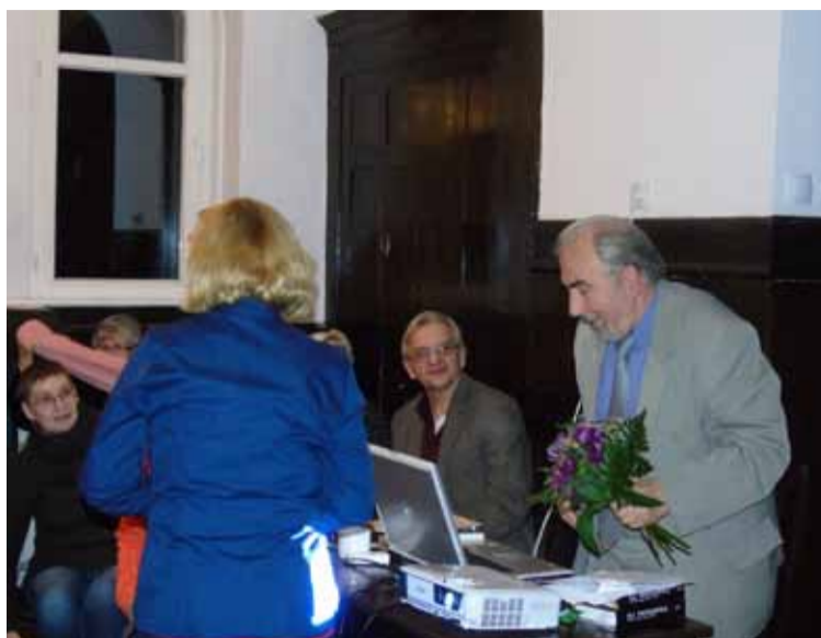
Wzruszony profesor wspominał, że w dzieciństwie często bywał w sali Biblioteki Jesiennej, wtedy świetlicy

Najważniejszą kobietą w życiu Witkacego? Kto był na wykładzie dowiedział się tego.