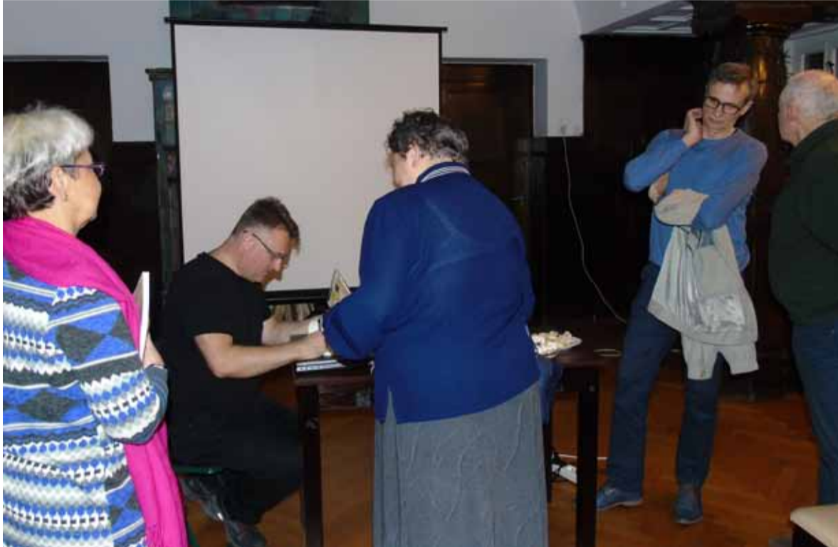
Na zdjęciu: Książka z autografem autora przywoła wspomnienia ze spotkania

Ponieważ taka podróż, to nie tylko spotkania uma-