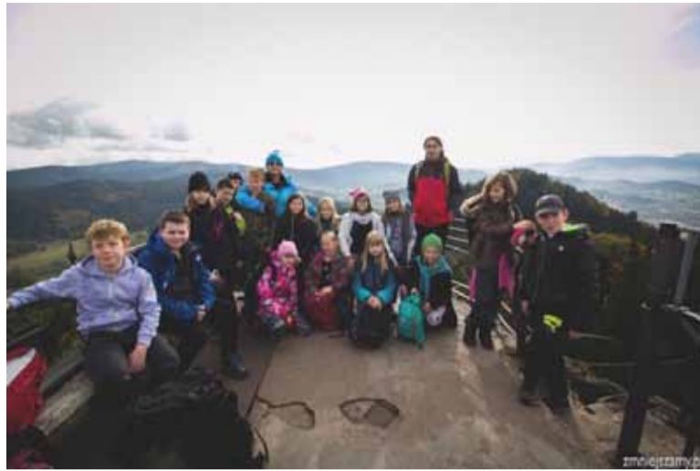
Młodzi turyści z opiekunami na szycie Gór Sokolich

Celem rajdu było zdobycie dwóch najwyższych szczytów Gór Sokolich. Cel został osiągnięty. Jednakże pogoda uczestników nie rozpieszczała. Zdecydowanie w gorszych warunkach wędrowali uczniowie klas starszych. Będąc na szczycie Sokolika Wielkiego i Krzyżnej Góry nie mogli podziwiać rozległej panoramy na Kotlinę Jeleniogórską, Karkonosze czy chociażby na Góry Kaczawskie. Bardzo gęsta mgła znacz-