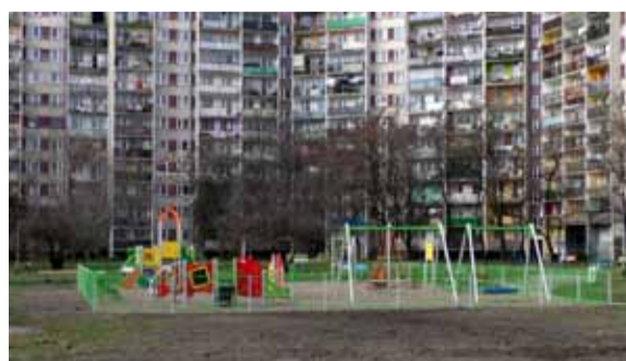
Plac zabaw Gaj