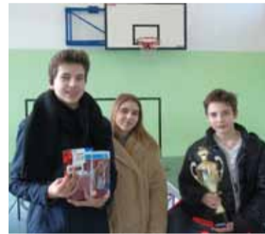
Zwycięzca kategorii Open prezentuje zdobyty puchar

Zwycięzcy w kategorii Gimnazjum to absolwenci SP 42