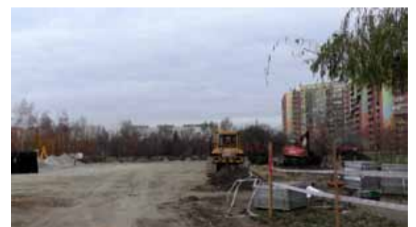
Budowa boiska Gaj