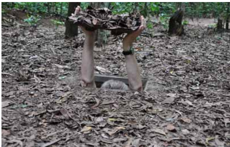
Podczas wizyty autorów w Wietnamie ugruntowała się decyzja napisania książki o podziemiach wydrążonych przez ludzi. Zamaskowane wejście do systemu tuneli Cu Chi, tuneli Wietkongu z czasów wojny wietnamskiej.

śląskich sztolni, morawskich winnych komór, zakonnych krypt Krakowa, Kijowa i Palermo, etruskich grot, jaskiń Narni (Tak! To fakt, nie literacka kreacja.), hiperdrogiego hotelu w trzewiach szwajcarskiej góry, studni prowadzących w głąbiny własnej jaźni, złotońskich dolnośląskich sztolni i ... jakich jeszcze – najlepiej przeczytać samemu. Wszystko bogato udokumentowane fotograficznie i podane z reporterską dociekliwością. Nasz region - Dolny Śląsk – jako obszar pełen zagadkowych podziemnych budowli np. w Górach Sowich czy pod