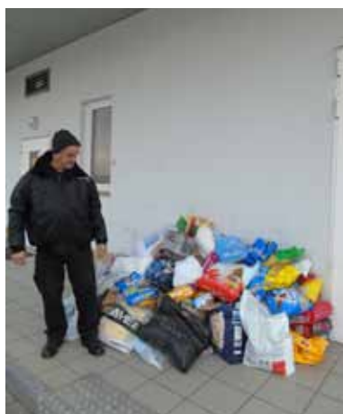
Pan Jan przyjmuje do magazynu dary od uczniów klas 4-7

Były to: puszki z karmą, kocyki, zabawki, sucha karma. Efekty tej zbiórki, przerosły oczekiwania. Ilość zgromadzonych darów okazała się imponująca. Dzieci z wielkim zaangażowaniem wzięły udział w akcji, miały duże wsparcie ze strony Rodziców. Nawiązana współpraca ze schroniskiem