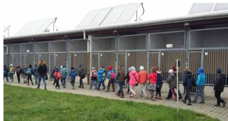
I B i III D podczas wizyty w Schronisku dla Bezdomnych Zwierząt