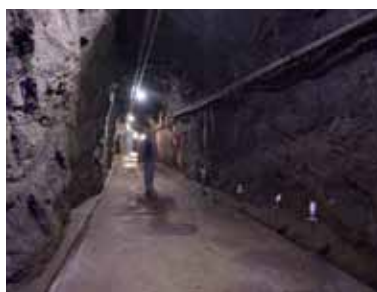
Spacer w podziemnym hotelu w Szwajcarii.