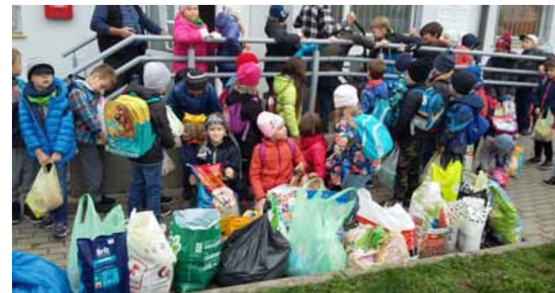
Przed wejściem do Schroniska - uczniowie I B i III D ze zgromadzonymi darami dla zwierząt