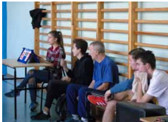
Absolwenci SP 42 uczestniczyli w rozgrywkach, kibicowali zawodnikom i pomagali sędziować