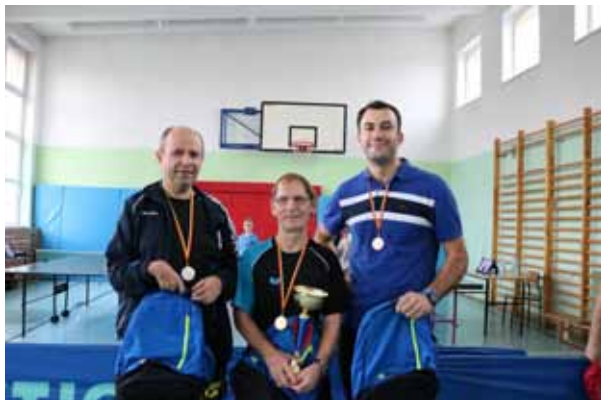
Te uśmiechy mówią wszystko - zwycięzcy w kategorii Open

W dniu 25 listopada 2017 roku w Szkole Podstawowej nr 42 we Wrocławiu odbył się XXIII turniej tenisa stołowego „Klecina Cup”, w którym udział wzięli uczniowie naszej szkoły,