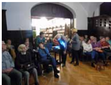
Klubowicze Jesiennej Biblioteki w oczekiwaniu na prezentację tajemnic podziemi